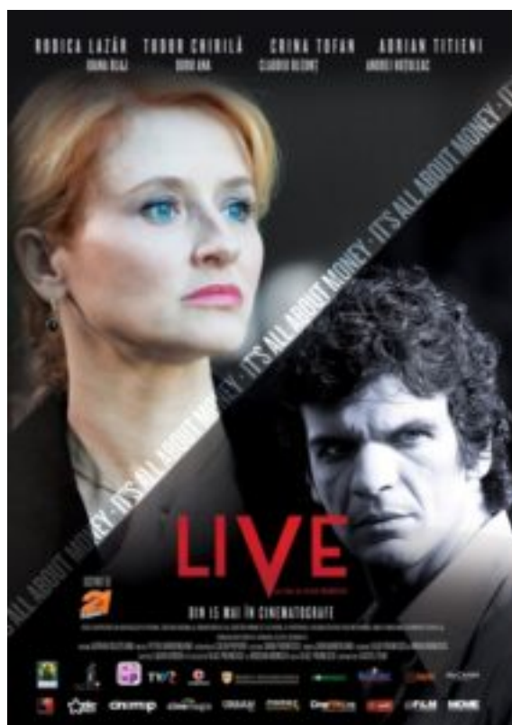
Film: « LIVE » (2015)

19h 30 – Soirée cinéma RomBel & Dacin Sara